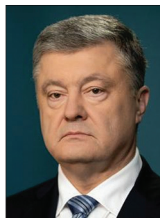
Президент України Петро Олексійович Порошенко 2014–2019 рр.